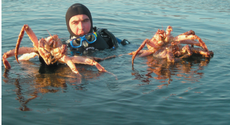
Kumskrabban har blivit en exklusiv vara och fisket är hårt reglerat.

Shtokman är det ryska gasfält som står närmast inför utvinning i Barents hav. Det ligger norr om Murmansk. Många energibolag har velat vara med i utbyggnaden, bland annat Norsk Hydro och Statoil. Vilka som tillsammans med ryska Gazprom kommer att utvinna fältet är ännu inte klart.